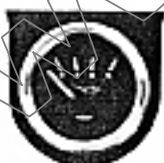
Ensemble "Manomètre électrique"