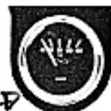
Ensemble "Thermomètre électrique huile"